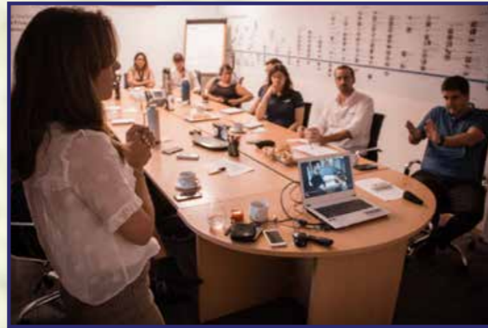
Asesoramiento / Ergonomía