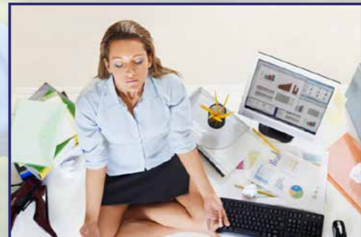
Yoga y Mindfulness